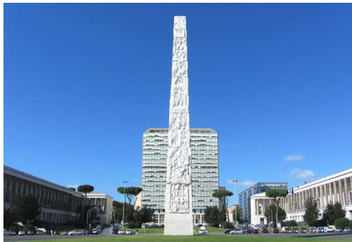
4. OBELISCO DI MARCONI