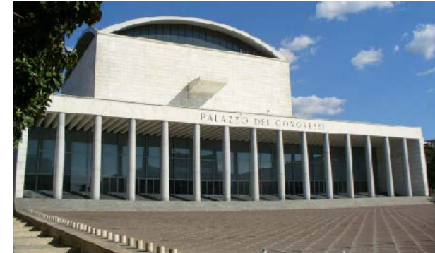
3. PALAZZO CONGRESSI