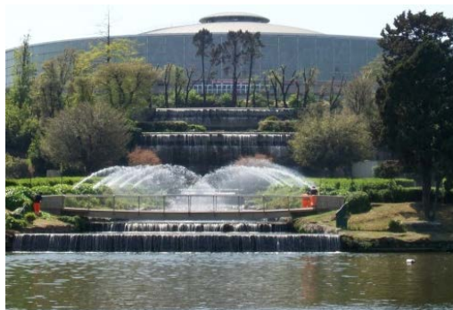
7. LAGO DELL'EUR