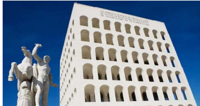
2. PALAZZO CIVILTÀ ITALIANA