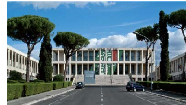
6. ARCHIVIO DI STATO