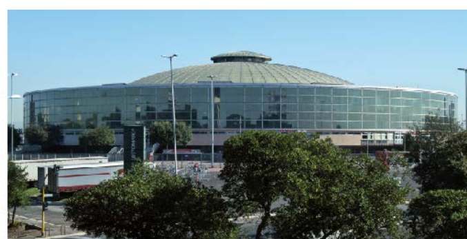
8. PALAZZO DELLO SPORT