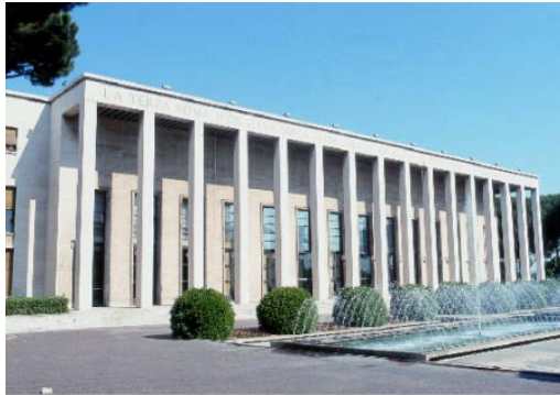
1. PALAZZO UFFICI