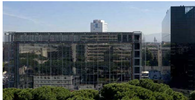
5. LA NUVOLO